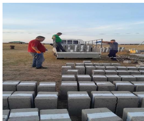
/ гахайн аж ахуй /